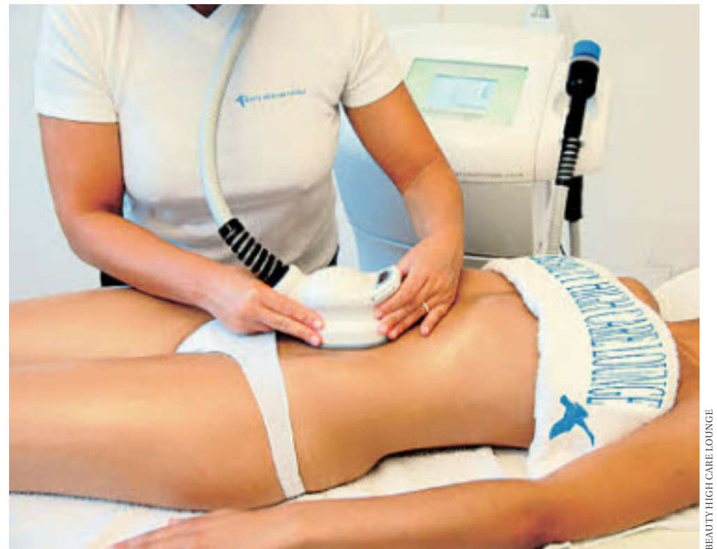
BEAUTY HIGH CARE LOUNGE

scheiden, haben Sie die effektivste und hautschonendste Methode zur dauerhaften Haarentfernung auf dem Markt gewählt: Aktuell - 30%! In der Beauty High Care Lounge winken laufend tolle Angebote zur Behandlung Ihrer Wahl.